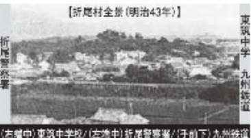
【折尾村全景(明治43年)】 東筑中学 九州鉄道 [右端]東筑中学校/[左端]折尾警察署/[下]九州鉄道

により狭くなった。江戸時代まで折尾は洞海湾の最奥にある小さな集落にすぎなかった。 2. 室町時代、明治時代の折尾 古文書での折尾の地名は室町時代の「麻生文書」に折尾郷と記載されている。文安5年(1448)の「麻生家知行目録写」によれば、その根本所領は山鹿の庄の三郷三村350町で、折尾、有毛、安生の三郷と雁手、藤田、穴生の三村となっている。次に、明治13年に完成した「福岡県地理誌」に明治時代初期の折尾村の記載があり、戸数87戸の農業主体の村落だった。