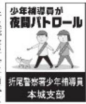
折尾警察署少年指導員

10月3日の「市民いっせいまち美化の日」を中心として、9月・10月間に行われる、道路や公園、河川などの一斉清掃について、協力依頼があった。 ●区政懇談会提出議題 11月19日に開催される区政懇談会の提出議題が決定した。(以下提出議題)①老朽化した地中埋設汚水管の更新予定について(本城東)、②県道11号の高架道路下(筑豊本線と交差する付近)歩行者道路の両サイドにある空き地の不法投棄について(折尾赤坂) ③本城西公園(南東角)排水溝の詰まり対策依頼と植樹予定について(本城西大浦)、④街路(水巻・中間、若原線)と江川沿いの道路の草刈について(三ツ頭) ●令和3年度八幡西区防災訓練 コロナ禍で延期になっていた八幡西区防災訓練の新たな計画案の説明があった。昨今の気象や災害を背景にした計画内容で、今後、さらに協議、調整が行われる。