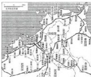
【筑前国の古代地図】(事典:日本古代の道と駅/木下良典09)

1. 遠賀川と洞海湾の変化 古代縄文時代の遠賀川流域は広大な入江(潟)だった。洞海湾も現在の3〜4倍も広がった。江