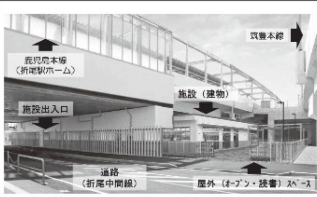
整備イメージ(外観パース)

●折尾駅高架下複合公共施設を整備します。 折尾駅の高架下に折尾まちづくり記念館と八幡図書館折尾分館を合わせ、折尾駅高架下複合公共施設として整備します。施設の間隔は令和4年春ごろになる予定です。 ●折尾駅高架下複合公共施設の施設概要(約800㎡) ○折尾まちづくり記念館(約420㎡) ○展示室(兼会議室)1室(約50㎡) ○会議室2室(各約50㎡) ○ブリースペース(約100㎡) ●折尾駅高架下複合公共施設の愛称公募 市民が愛着を持てる施設とするため、愛称を公募します。 ①募集期間 令和3年9月30日(木)必着 ②応募内容 ○施設の愛称 ○愛称の説明・理由 ○応募方法 ○市ホームページ上の応募フォームから送信 ○応募用紙または任意の用紙に必要事項を記入の上、郵送またはDAX ③注意事項 ○応募点数は、1人1点とする。(複数応募は無効)