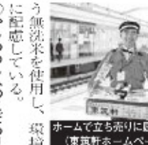
ホームで立ち売りに取り組む小間使

無洗米を使用し、環境に配慮している。 立ち売りへのこだわり 一期一会の出会いを大切に 折尾駅のホームでは現在も販売が行われていて、全国でも数少ないため、それを目当てに訪れる人も多く、古き良き時代の情景を残している。