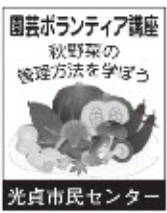
光貞市民センター

参加者は反対ジャケットを着た中電灯を持ってパトロールを実施している。不良行為少年の発見、非行少年、被害少年及び要保護少年の発見などを目的に活動。以前は本城駅、友田などをパトロールしていたが、今のところ問題は発生していない。