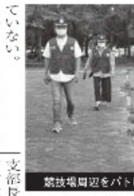
競技場周辺をパトロールする少年指導員

折尾警察署少年指導員本城支部は毎月第3金曜日(8月は20日)、本城陸上競技場で夜間パトロールを実施している。不良行為少年の発見、非行少年、被害少年及び要保護少年の発見などを目的に活動。以前は本城駅、友田などをパトロールしていたが、今のところ問題は発生していない。