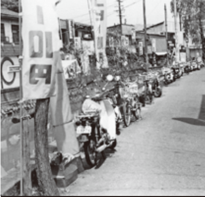
堀川沿いに止められたバイクや自転車。遠くに折尾駅舎が見える(写真右上)