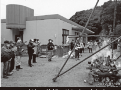
新年の挨拶で乾杯する参加者

「どんど焼き大会」があり、約230人の参加者が燃え上がる炎で顔を染めながら、1年の無病息災を祈願した。今年はずいぶん寒い中、子どもたちも参加も多かった。