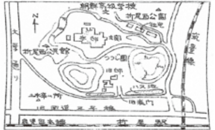
折尾移転後の三好邸(「石炭物語」柴田貞志より)

『三たびの海峡』は太平洋戦争前後の時代に朝鮮半島出身の男性が筑豊の炭鉱で働く苦勞が記されている。最初の渡海、故郷への帰還、戦後の再訪の折に、芦屋と折尾とN市(中間市)をまたぐ行動が登場する。