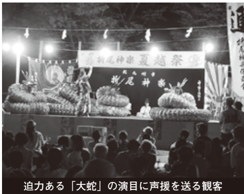
迫力ある「大蛇」の演目に声援を送る観客

毘沙門堂 福岡東北九州市八幡西区則松240-1 http://bishamonou.com © 093-601-9830