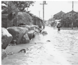
★県道かさ上げ関連による周辺家屋の地上げ

この間、昭和55年4月5日に、家屋組合、農地組合、水害組合の三組合が、発展的に一本化統合した。以来10年余り組合を中心に各種の活動を展開してきた。